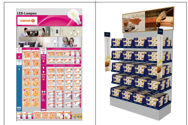
Beispiele Darstellung Planogramme